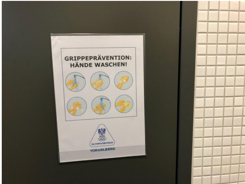
WC – Hinweis Händewaschen