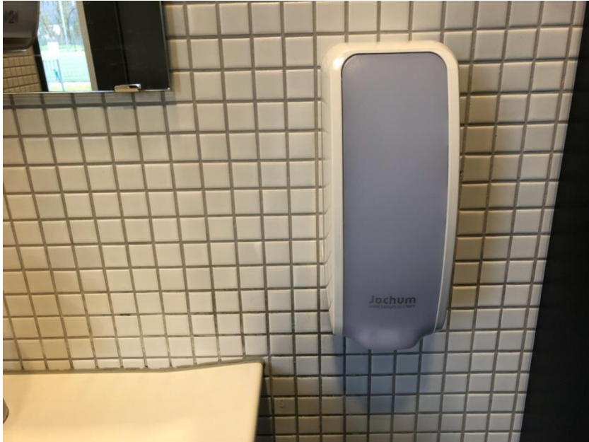
WC – Seifenspender