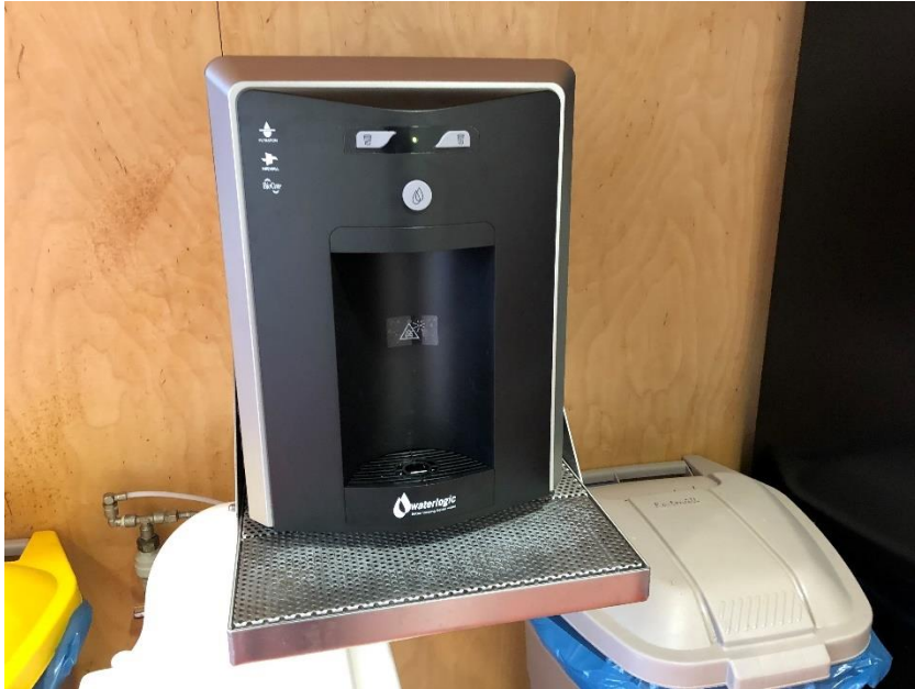
Wasserspender mit keimfreiem Leitungswasser