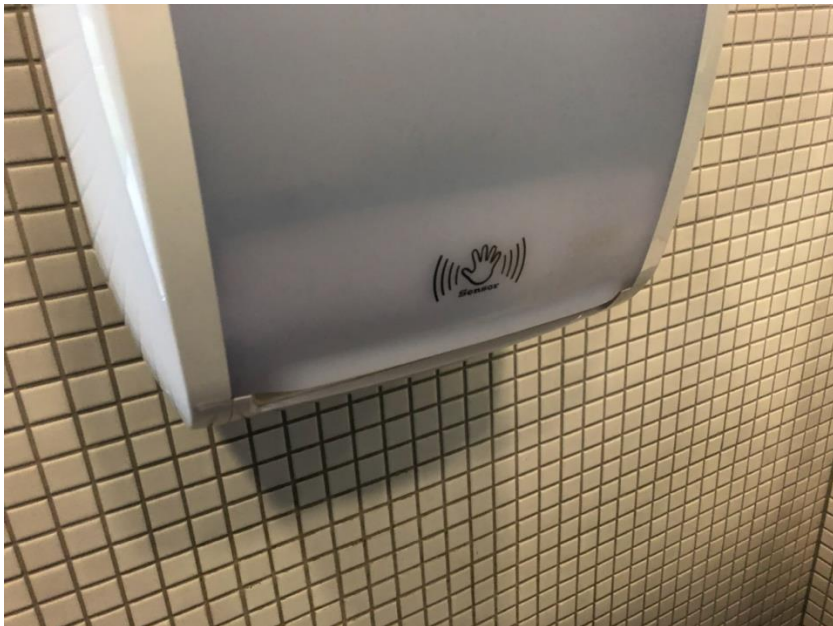
WC – berührungsloser Papierhandtuchspender